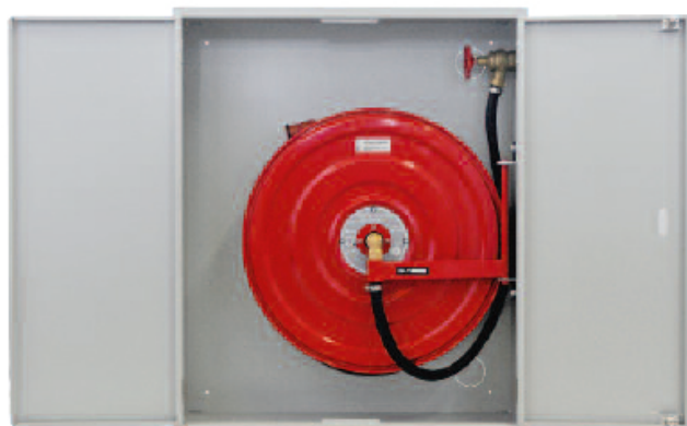
Le poste d'incendie fonctionnel: LPA/U 20-40 m, avec couche de fond, pour montage apparent ou encastré.