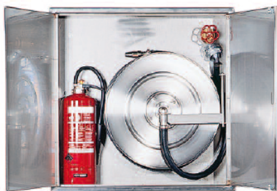
Coffret et dévidoir en acier inoxydable