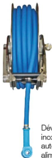
Dévidoir rétractable en inox par ex. pour parcs automobiles ou industrie alimentaire