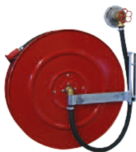
Le dévidoir pivotant LPO avec 20-40m de tuyau

Notre catalogue des produits propose un système modulaire étudié et varié pour la conception de postes d'incendie adaptés à vos besoins.