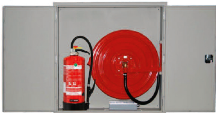
Individuel: Gel? Le chauffage 230 V intégré dans le coffret permet l'utilisation permanente du poste d'incendie