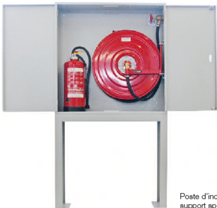
Poste d'incendie avec support spécial