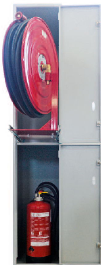
Individuel: En présence d'espaces réduits: Coffret avec dévidoir coulissant