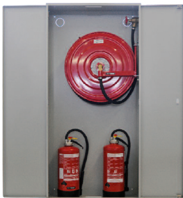
Le poste d'incendie LPA/U2S 20-40 m avec place pour deux extincteurs en dessous du dévidoir