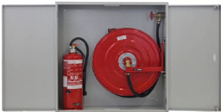
Le poste d'incendie LPA/U2W 20-40 m avec place pour un extincteur à coté du dévidoir