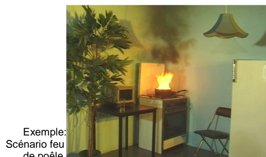
Exemple: Scénario feu de poêle

Tél: 061 436 50 16 ou 50 19 schulungen@primus-ag.ch www.primus-ag.ch