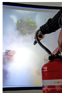
3. Le participant actionne l'extincteur