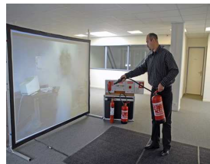
4. La distance d'intervention doit être respectée, comme en situation réelle