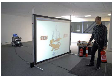
1. Le rétroprojecteur/écran pour la formation