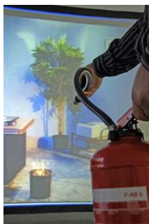
2. Corbeille à papier en feu virtuellement