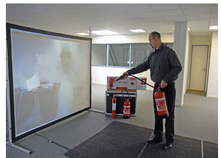
4. Wie beim richtigen Löschen muss die Distanz zum virtuellen Feuer stimmen