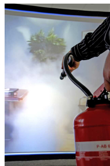
3. Teilnehmer löscht Feuer im Papierkorb