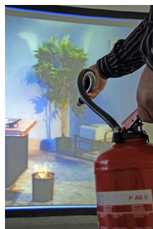
2. Papierkorb brennt virtuell