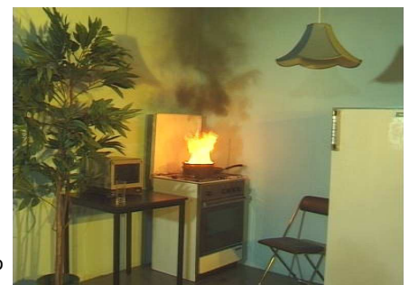
Beispiel Brandszenario Pfannenbrand

Tel: 061 436 50 16 oder 50 19 schulungen@primus-ag.ch www.primus-ag.ch