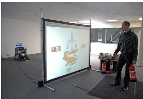
1. Beamer/Leinwand für virtuelles Löschen bereit