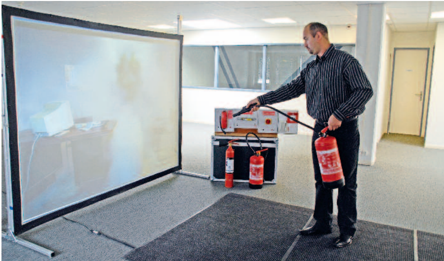
Wie beim richtigen Löschen muss die Distanz zum virtuellen Feuer stimmen