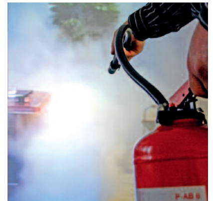
Teilnehmer löscht Feuer im Papierkorb