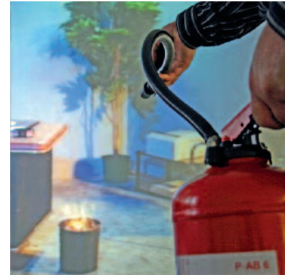
Papierkorb brennt virtuell

PRIMUS BRANDSCHUTZ PROTECTION INCENDIE PROTEZIONE ANTINCENDIO